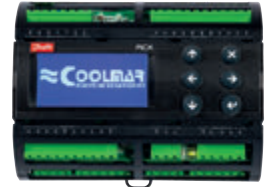
DANFOSS CHILLER CONTROL