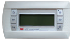
CAREL CHILLER CONTROL