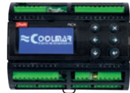
DANFOSS CHILLER CONTROL